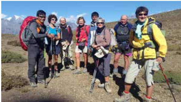
Trek au Mustang : septembre – octobre 2014