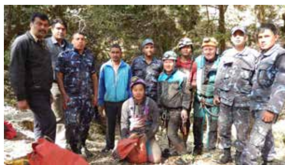
A la sortie de Patal Bumeshwar, record de profondeur du Népal

Topographie également de la grotte de Parbati Gufa dans le village de Korkot situé à quelques kilomètres de Kushma bazar.