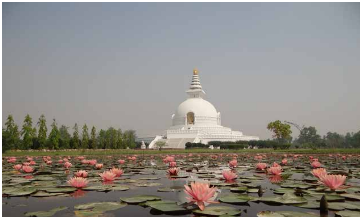
Lumbini, lieu présumé de la naissance de Bouddha