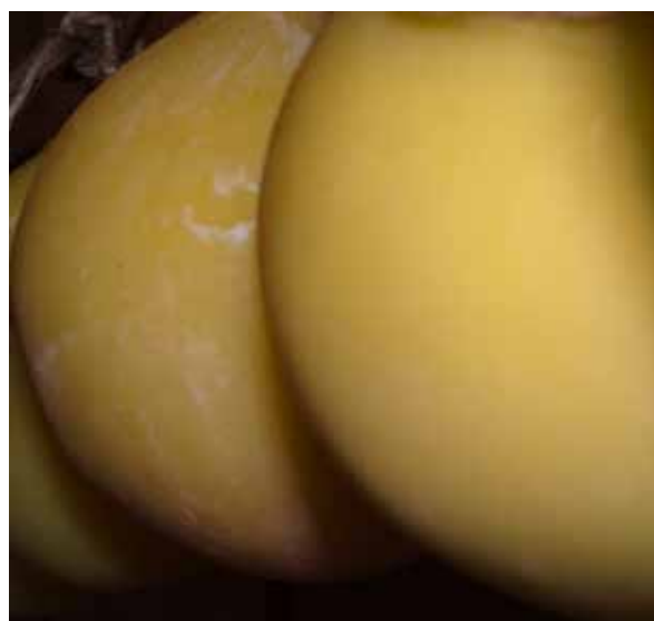
Fromages de yack au Langtang (extrait du film Népal Yak Cheese). Etonnant, n'est-ce-pas !