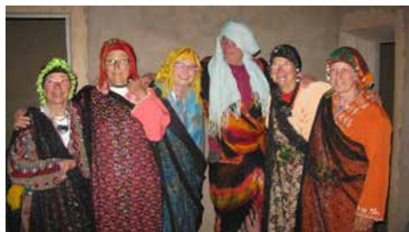
L'équipe féminine de ICEH ! : trek au Maroc mai 2014

Dans les projets, nous devrions dans l'année à venir effectuer une reconnaissance dans les cavités calcaires du col du Thorung La au nord de l'Annapurna (entre 5500 et 5800 m d'altitude, parmi les plus élevées du globe) et dans les cavités intra-glaciaires du Manaslu. Il y a aussi les topographies à faire de Crystal cave à Pokhara, celles aussi des trois grottes de Bhimad, et bien sûr revenir si possible dans l'extrême ouest pour poursuivre les explorations en cours. Enfin le glacier « Sous la forêt la glace » reste attirant pour réaliser un petit documentaire.