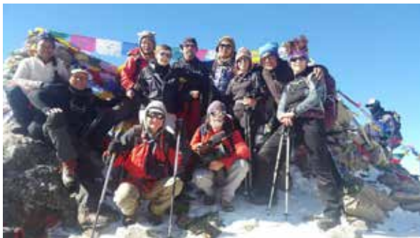
Laurébina Pass 4660m, Langtang : octobre - novembre 2014