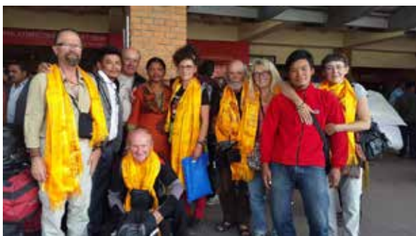
Les Ragaïe sur le départ à l'aéroport de Katmandu : novembre 2014

A titre plus personnel j'ai visité une partie de la basse vallée de la Bouddhi Gandaki qui pourrait faire l'objet d'un séjour intéressant en ouverture du tour du Manaslu.