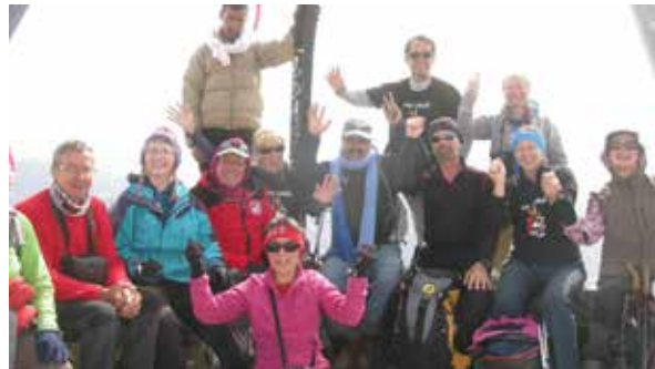
Maroc l'équipe ICEH au sommet du Toubkal : mai 2014

Treize d'entre nous sont allés au Maroc ascensionner le Toubkal et le M'Goun deux sommets de plus de 4000 mètres dont le plus haut de l'Atlas avec un retour par la Vallée des Roses et dans une ambiance délirante.