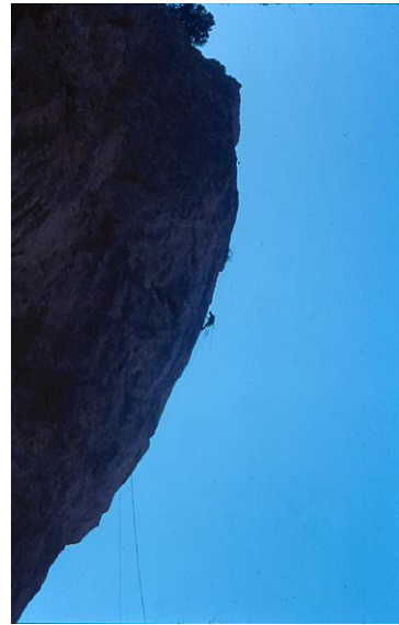
Mont Caumes dernières longueurs