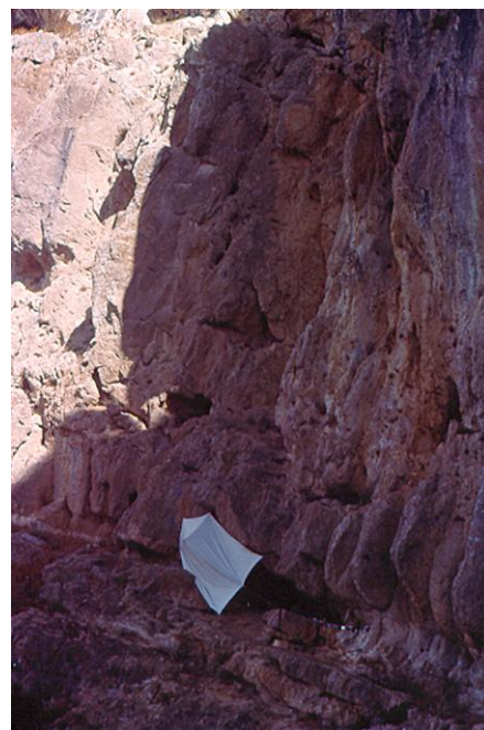
Mont caumes notre campement