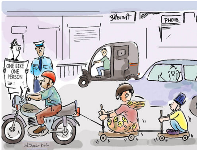
One bike one person