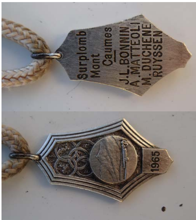
Mont Caumes Médaille J&Sports