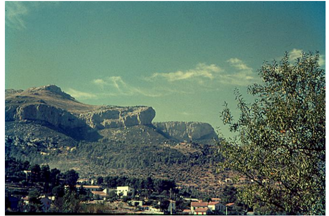
Le mont caumes et son grand surplomb

Merci à chacun de prendre contact pour un séjour. Du simple tourisme en famille (Vallée de Kathmandu, Pokhara, les parcs du Terrail), à une courte ou longue et belle randonnée, voir un sommet pas trop difficile, tout est possible au Népal. Les grands sommets aussi, mais pour des alpinistes confirmés et vous l'aurez compris ce n'est pas pour moi.