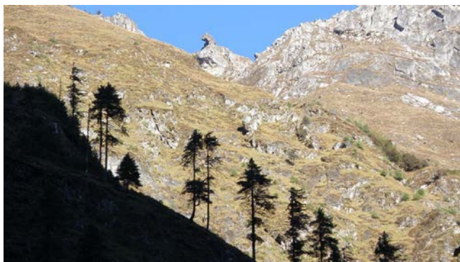
Le surplomb qui nous nargue sur le tour du Manaslu