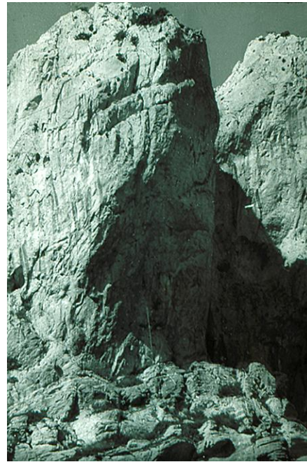
Le grand surplomb impressionnant