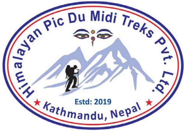
Logo Himalayan Pic du Midi